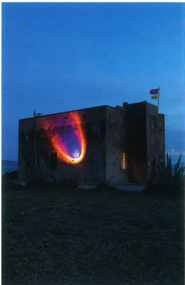
Mandalaki, Hymn to the Sun, Torre di Talamonaccio, Talamone